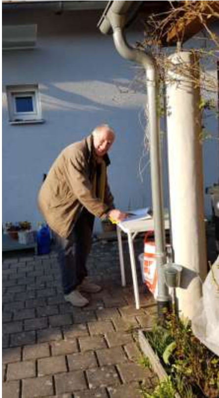
Organisation in Pandemie-Zeiten

Um weiterhin handlungsfähig zu bleiben und die Region auch in Krisenzeiten weiter voranzubringen, wurden die Projektauswahlverfahren sowie weitere LAG-interne Angelegenheiten im Zeitraum von Mai 2020 bis April 2021 schriftlich im besonderen Umlaufverfahren durchgeführt. Die Einschränkungen durch die Corona-Pandemie ließen in diesem Zusammenhang