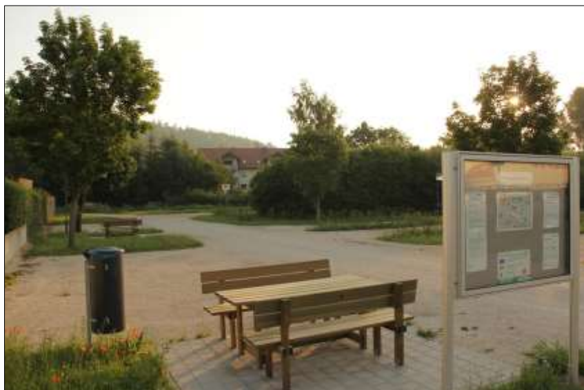
Wohnmobilstellplatz an der Thalach