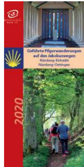
Faltblatt Pilgerwanderungen 2020

Unser herzlichster Dank gilt dabei Eva Schultheiß für ihr großes Engagement, ohne welches die Erstellung des Faltblattes nicht möglich wäre!