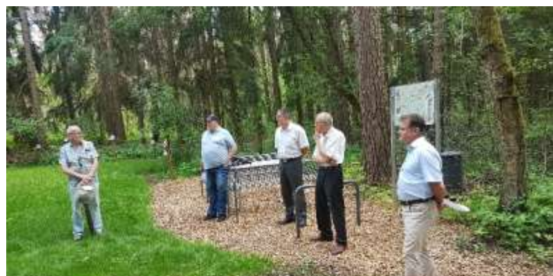
Einweihung der Mühlen- und Industriegeschichtstour in Furth