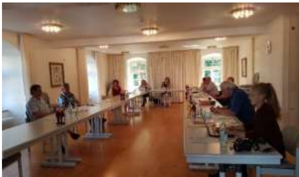
Fachgespräch Bereich Natur & Umwelt

Zur Umsetzung des Projektes wurde das Büro landimpuls aus Regenstauf beauftragt. Im Sommer 2020 wurden Expertengespräche mit Vertretern aus den Fachbereichen Naturschutz, Fischerei & Wasserwirtschaft, Landwirtschaft und dem Forst geführt. Weitere Gespräche, unter anderem auf kommunaler Ebene waren für Herbst 2020 angesetzt, diese mussten aber aufgrund der Corona-Pandemie auf das Jahr 2021 verschoben werden. Die Projektgesamtkosten wurden mit 25.000 € veranschlagt. Die bewilligte LEADER-Fördersumme liegt bei 12.600 €.