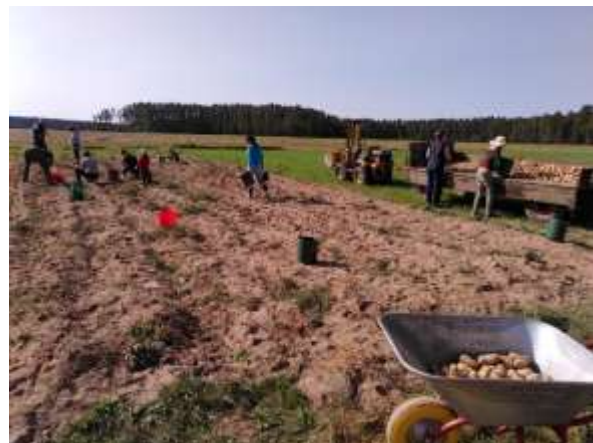
Mitmachtage in der Alternativen Landwirtschaft, August 2020