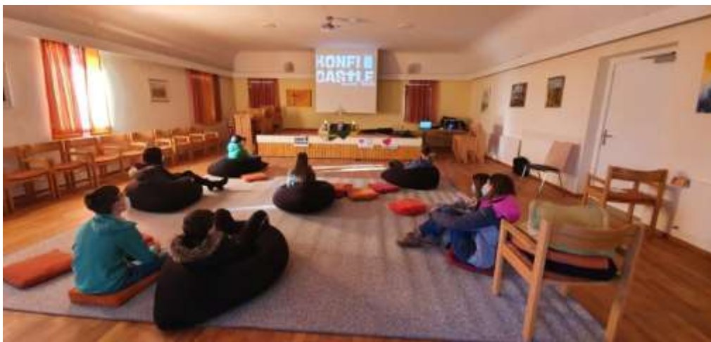
Einsatz der neuen technischen Ausstattung während der Corona-Pandemie

Die finanzielle Unterstützung wurde zur Anschaffung einer modernen technischen Ausstattung für das Projekt eingesetzt.