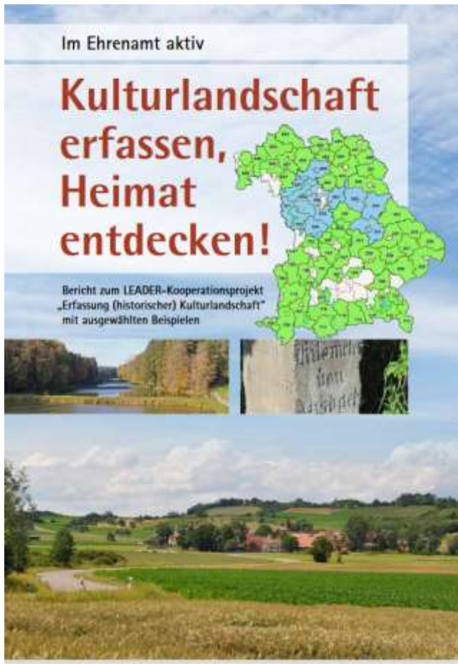
Abschlussbroschüre „Erfassung historischer Kulturlandschaften“

Im Zuge dieses Kooperationsprojekts von insgesamt 12 LAGn aus Mittelfranken und der Oberpfalz, soll das Wissen über die zahlreichen Kulturlandschaftselemente der Regionen für die Nachwelt gesichert und öffentlich zugänglich gemacht werden. Ehrenamtliche sammelten und erfassten Informationen zu Kulturlandschaftselementen und veröffentlichten diese in der extra für das Projekt angelegten Datenbank. Im Rahmen des Projektes fanden bisher regelmäßige Treffen und Schulungen statt. Diese konnten leider im Jahr 2020 aufgrund der Corona-Pandemie nicht stattfinden. Das Projekt konnte dennoch nach dreijähriger Projektlaufzeit abgeschlossen werden. Eine Abschlussbroschüre mit ausgewählten Beispielen aus den 12 beteiligten LAGn wurde zusammengestellt und kann bei Interesse in der Geschäftsstelle der LAG ErLebenswelt Roth kostenlos bestellt werden.