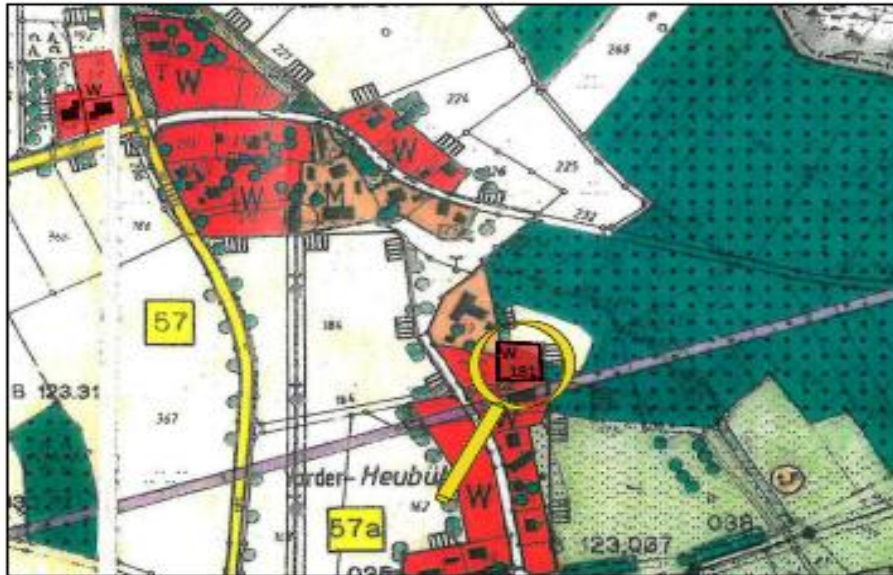
42. Änderung - Flächennutzungsplan mit Landschaftsplan, Flurstück 181 Gemarkung Birkach

Öffentliche Auslegung gem. § 3 Abs. 2 S. 1 BauGB