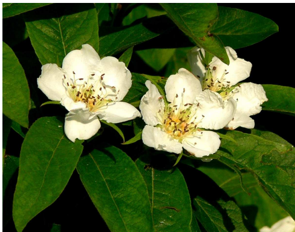
Blüte Mitte -Ende Mai

Abschmecken mit etwas frischer Vanille. In Gläser füllen.