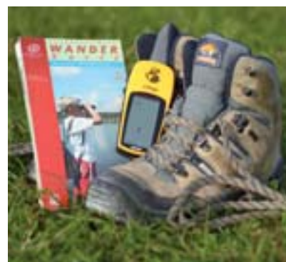
Der Landkreis Roth bietet eine Schnupper-GPS-Wanderung an.

Treffpunkt ist um 9.30 Uhr am Eichelburger Hof, Hauptstr. 2, 91154 Roth-Eichelburg. Da die Teilnehmerzahl begrenzt ist, ist eine Anmeldung erforderlich.