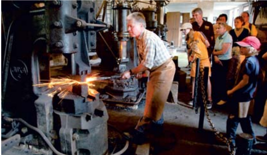
Der Historische Eisenhammer feiert sein 25-jähriges Jubiläum mit vielen Veranstaltungen.

Seit 25 Jahren können sich Besucher des Historischen Eisenhammers in Eckersmühlen an funkensprühenden Schmiedevorfürungen, einem Rundgang durch das liebevoll restaurierte ehemalige Herrenhaus und an authentischen Exponaten in der Dauerausstellung „Vom Erz zum Eisen“ erfreuen. Doch wie begann die nunmehr 25-jährige Geschichte des noch heute lebendigen Museumsgehöftes?