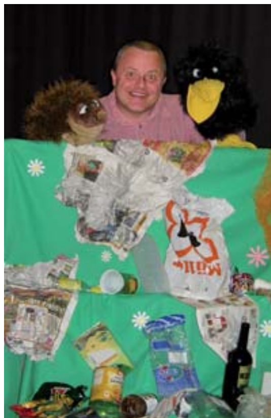
Mit dem Umwelttheater lernen die Kinder die richtige Abfallentsorgung kennen.