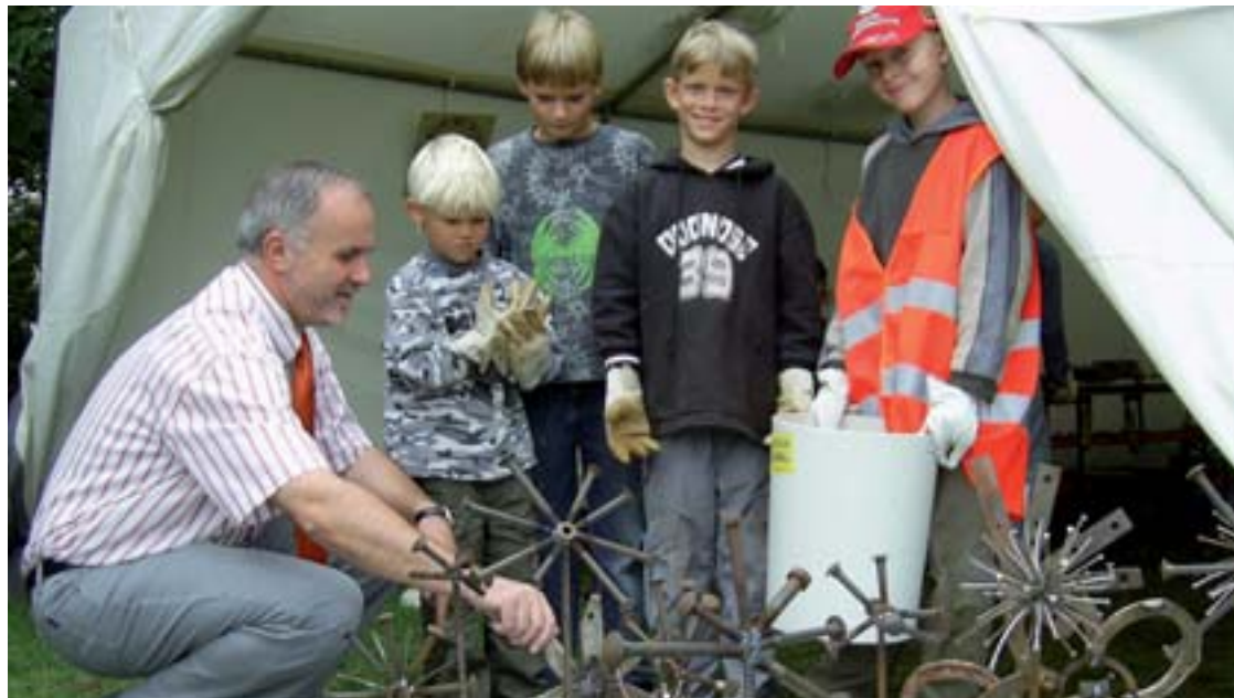
In diesem Jahr wird es wieder die beliebte Ferienpassaktion Mini-Roth geben.

Langeweile zu Hause in den Ferien? Das muss nicht sein! Jede Menge Action und Spaß bietet der Ferienpass. Ab den Pfingstferien bis zum Ende der Sommerferien haben Kinder und Jugendliche die Qual der Wahl zwischen Ausflügen, Aktionen und kreativen Angeboten.