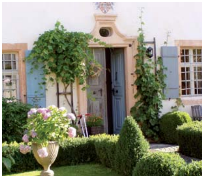
Am 26. Juni öffnen besonders sehenswerte Gärten ihre Pforten.

Das Falblatt mit den Lageplänen ist erhältlich beim Landratsamt, bei den Gemeinden, den Häusern des Gastes, den Obst- und Gartenbauvereinen oder im Internet unter www.landratsamt-roth.de bzw. www.gartenbauvereine.org (alle Regierungsbezirke in Bayern). Infos unter 09171 81-411.