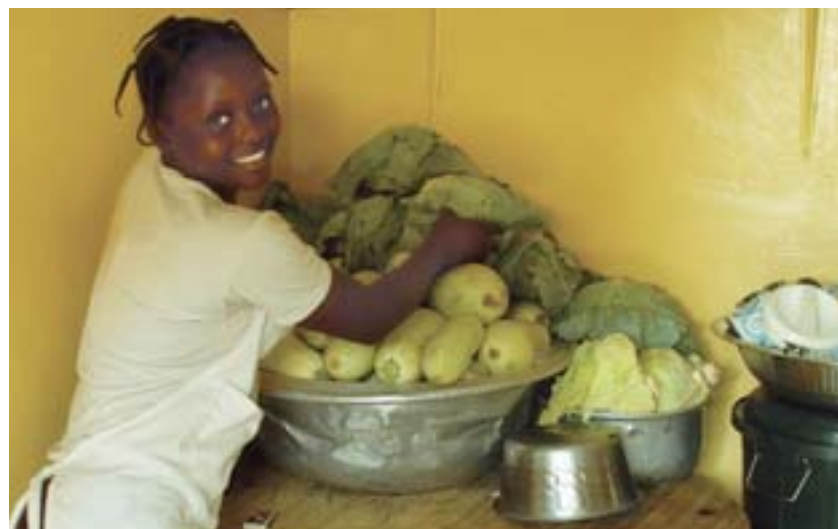
Diesem Mädchen, das in einem Mehrgenerationenhaus in Burkina Faso lebt, hilft die Aktion „Jeder Bürger ein Euro“.