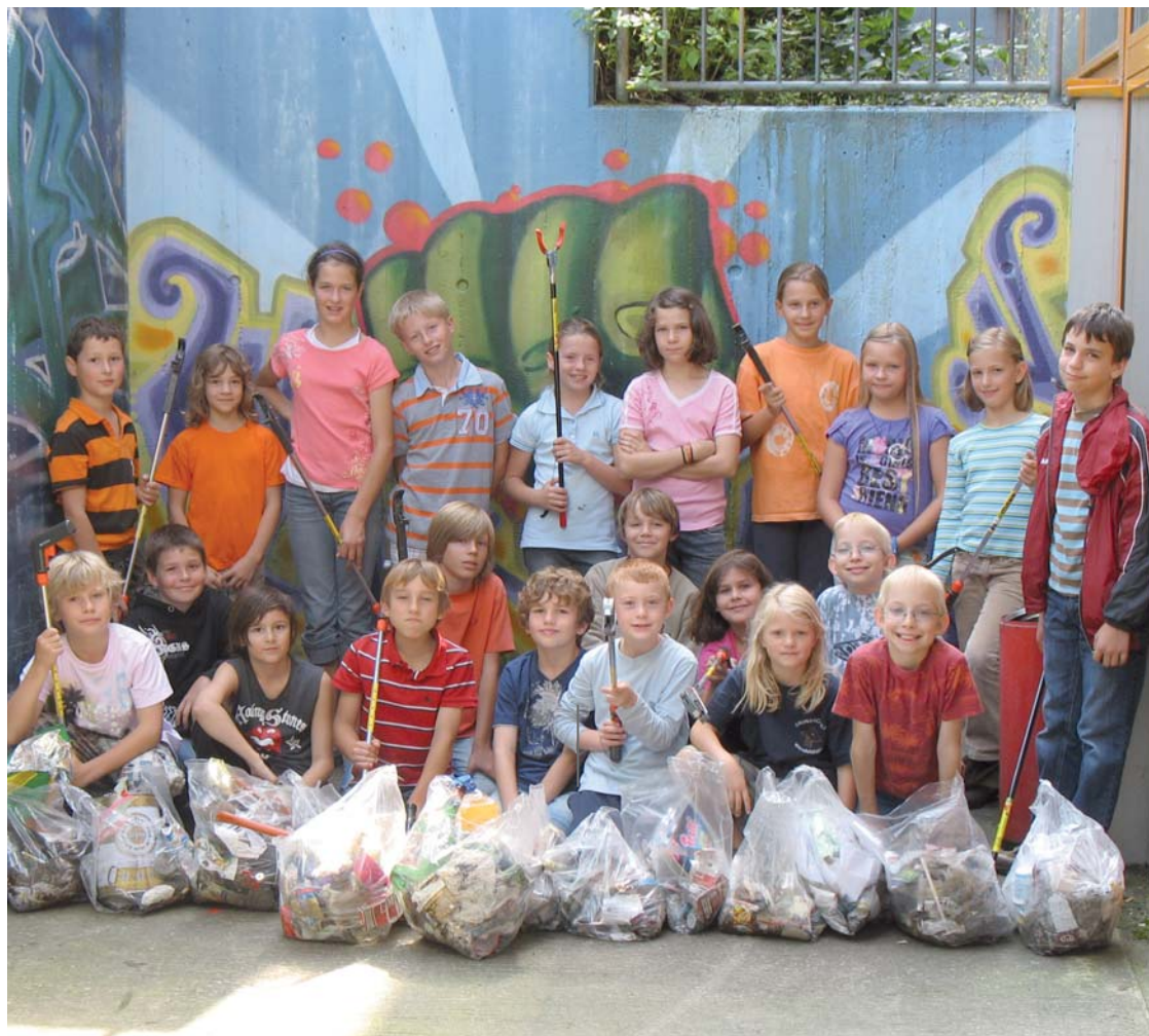
Die Wendelsteiner Kinder hatten im Handumdrehen rund 15 Säcke Müll gesammelt.

In den Sommerferien engagierten sich etwa 20 Wendelsteiner Kinder in Sachen Umweltschutz. Sie sammelten herumliegenden Müll rund um das Kinder- und Jugendbüro in Wendelstein ein. In nur zwei Stunden haben sie gut 15 Säcke voller Unrat gesammelt.