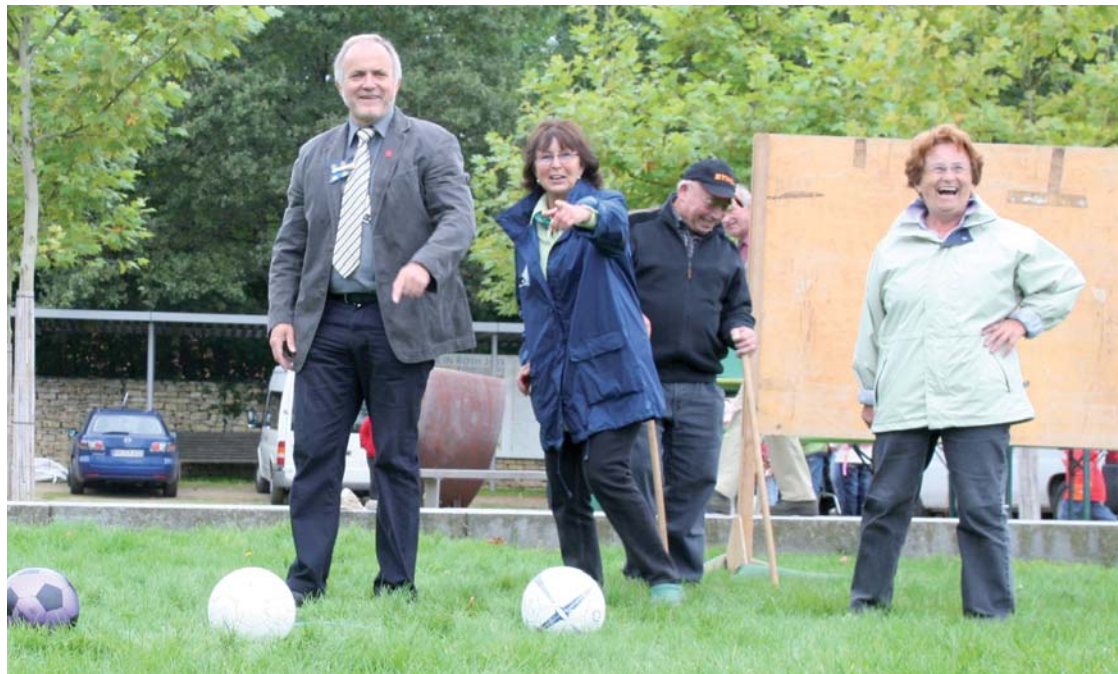
Aktiv beim Seniorentag: Auch Landrat Herbert Eckstein probierte sich am Torwandschießen.

Ein ganzer Tag nur für Senioren: Am 8. September fand der zwölfte Landkreis-Seniorentag statt. Die Informationsbörse ist für viele ältere Menschen mittlerweile ein „Pflichttermin“, der aus dem Veranstaltungskalender des Landkreises nicht mehr wegzudenken ist.