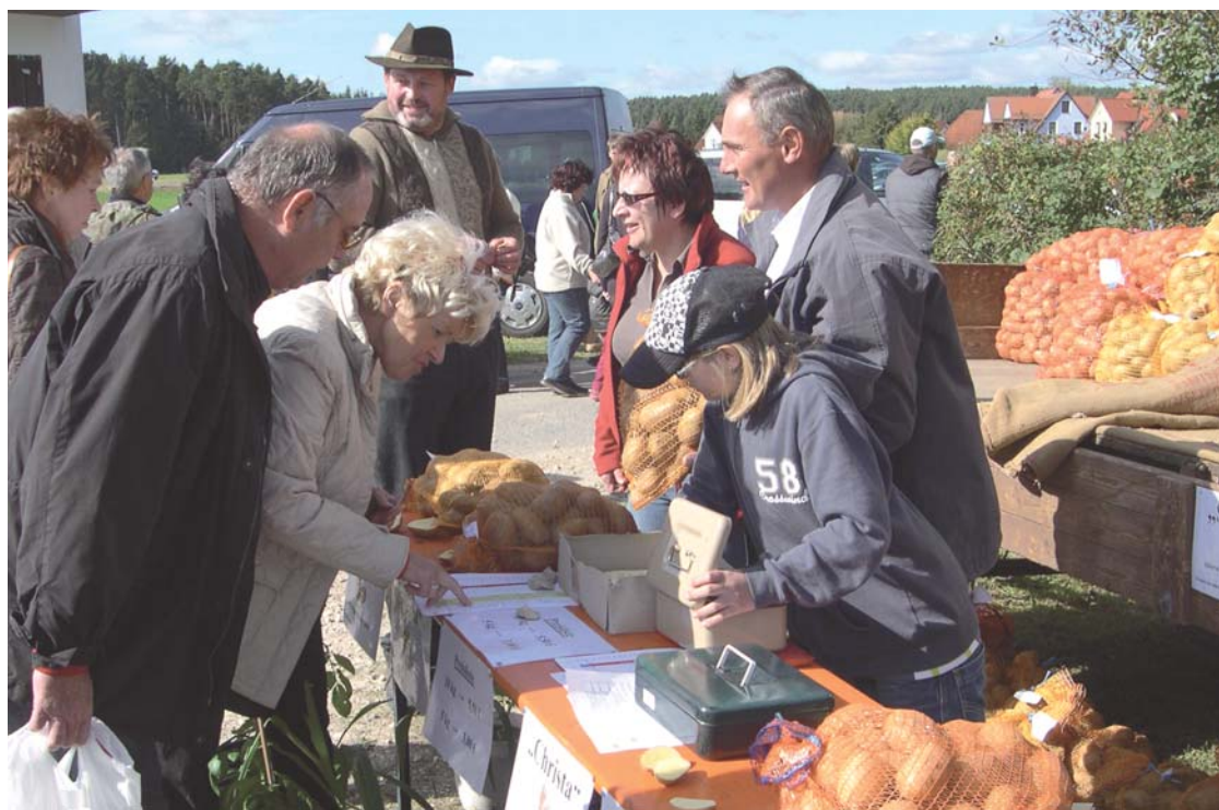
Kartoffelmarkt, Obstbörse, Holzmarkt - der Oktober steht im Zeichen von „Original-Regional“

Der Oktober steht ganz im Zeichen von original-regional: Am Sonntag, 10. Oktober, bieten mit der Obstbörse in Roth und dem Holztag in Roth-Hofstetten gleich zwei Veranstaltungen Informationen und Aktionen rund um regionale Produkte. Bereits eine Woche zuvor findet in Röttenbach der beliebte Kartoffelmarkt statt (siehe eigener Artikel rechts).