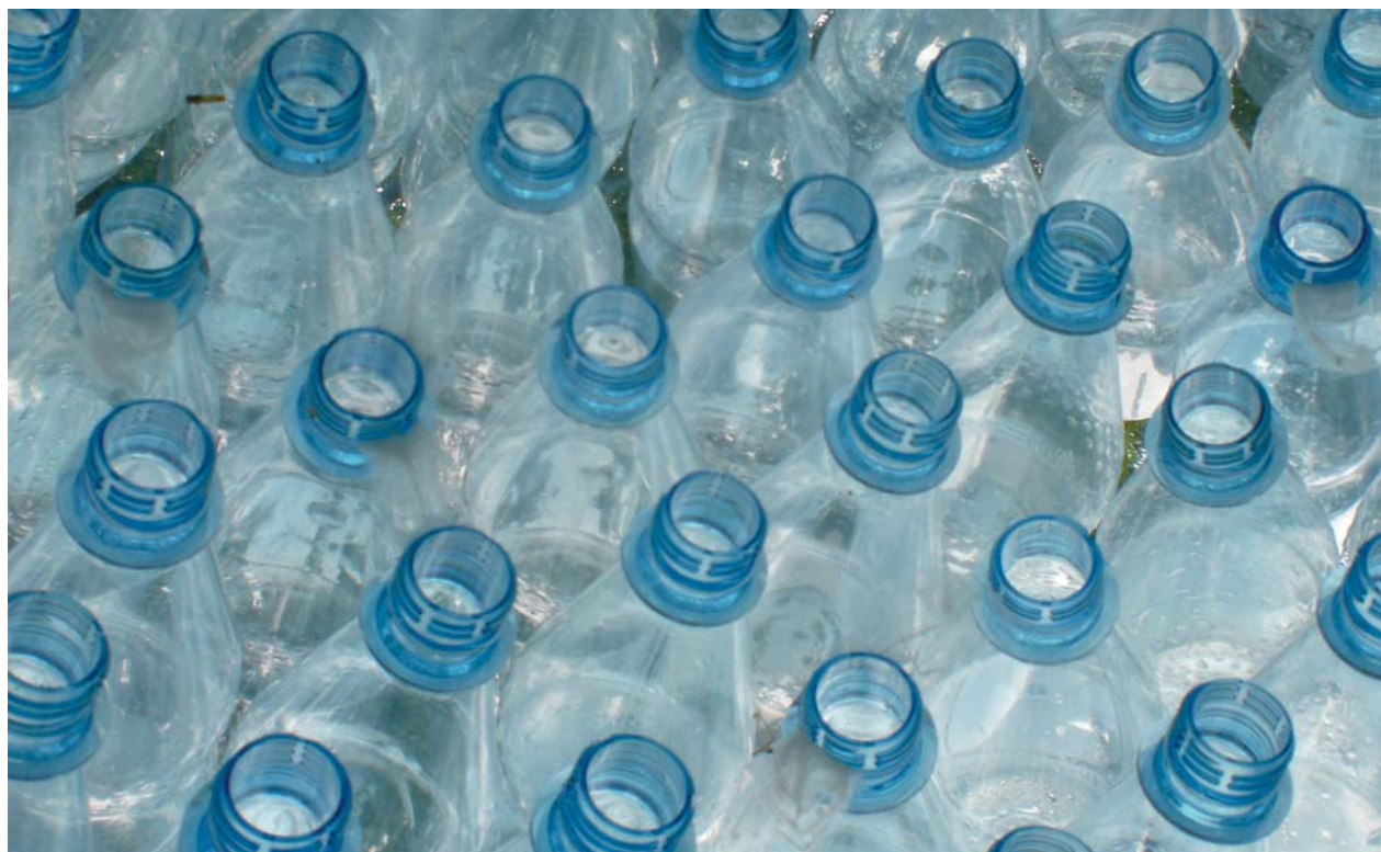
Einweg oder Mehrweg? Das Pfandzeichen sagt's.

Neben dem Mehrwegsystem helfen auch kurze Transportwege, den CO 2 -Ausstoß zu reduzieren. Deshalb sollten Kunden regionale Produkte (zum Beispiel Mineralwasser, Erfrischungsgetränke oder Milch aus dem Landkreis Roth) bevorzugen!